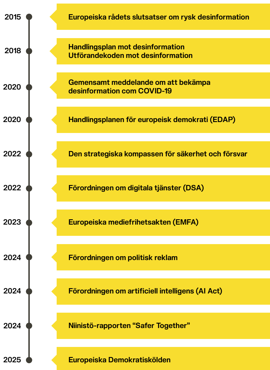
FIGUR 1. ÖVERSIKT ÖVER CENTRALA EU-INITIATIV FÖR ATT MOTVERKA FIMI

Unionen har därmed etablerat en tvärfunktionell modell där FIMI hanteras genom existerande rättsområden: digital reglering, yttrandefrihet, cybersäkerhet och extern säkerhet. Det har gett utrymme för utvecklingen av ett omfattande, men fortfarande fragmenterat, åtgärdssystem.